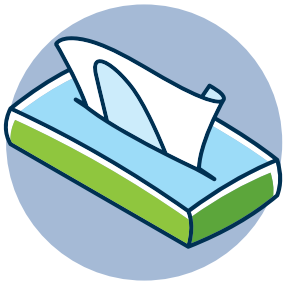
Pañuelos de papel