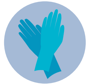
Guantes desechables sin látex